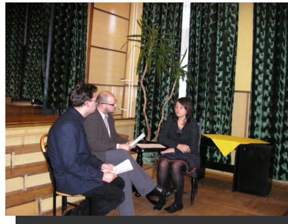
Dyrektor szkoły detektywów